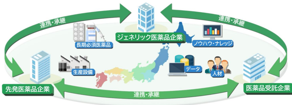
【図1】先発医薬品企業・ジェネリック医薬品企業・医薬品製造受託企業間の連携概念図

先発医薬品の特許満了を起点とした特許満了医薬品*1（特許が満了した先発医薬品＋ジェネリック医薬品）を1つの大きな市場として捉え、同市場に携わる全てのステークホルダーが互いに連携し、持続可能な産業構造に改革していく必要性が高まっています。