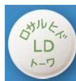
(ロサルヒド配合錠)