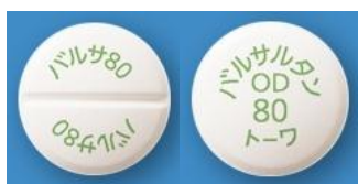
(バルサルタン OD 錠)

製品名印刷をおこなっているのは、バルサルタン OD 錠 20mg/40mg/80mg 「トーフ」、ロサルヒド配合錠 LD 「トーフ」、オロパタジン塩酸塩 OD 錠 2.5mg/5mg 「トーフ」です。このうち、ロサルヒド配合錠 LD 「トーフ」は、OD 錠以外の錠剤として初めて製品名印刷をおこないました。