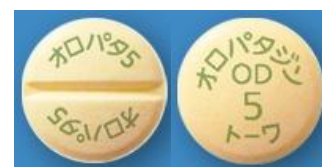
(オロパタジン塩酸塩 OD 錠)