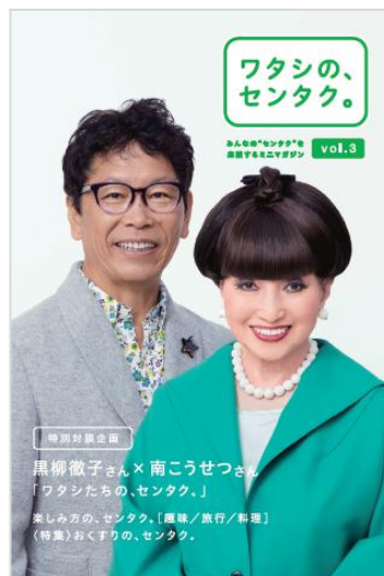
「ワタシの、センタク。」小冊子 vol.3

<CMに関する報道関係者からのお問い合わせ先> 株式会社 電通パブリックリレーションズ 関西支社 担当：藤田・碓山 TEL：06-6342-3369 FAX 06-6342-3377