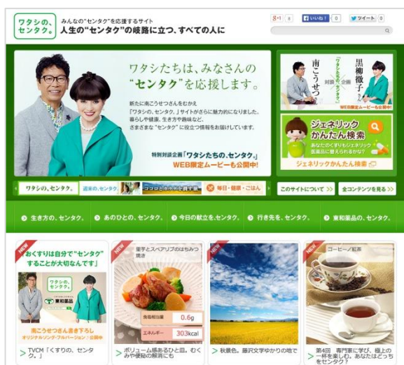
「ワタシの、センタク。」ウェブサイト トップページ